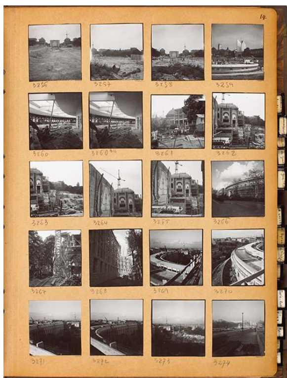
Chantiers de l'Exposition de 1937, palais du Trocadéro. Photographie d'Emmanuel Sougez septembre 1936-mai 1937, planche de contacts 6 x 6 au gélatino-bromure d'argent, N°Inv. 80.3590.9.