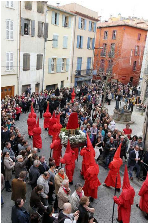
La procession de la Sanch à Perpignan.