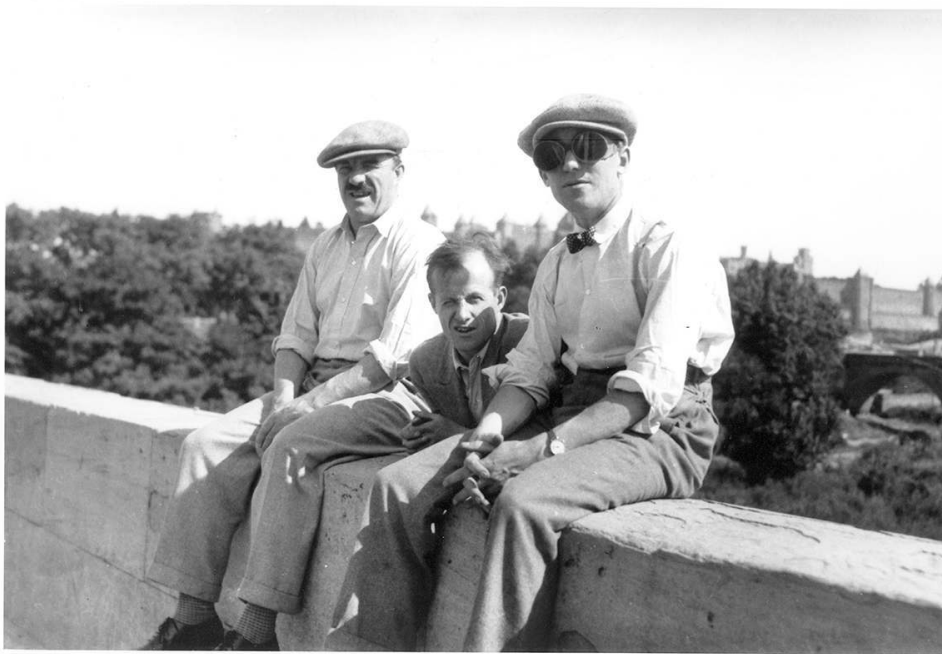
Fernand Léger, Pierre Jeanneret et Le Corbusier en Espagne, juillet 1930, épreuve gélatino-argentique, Fondation Le Corbusier (FLC-L4-14-16-001).