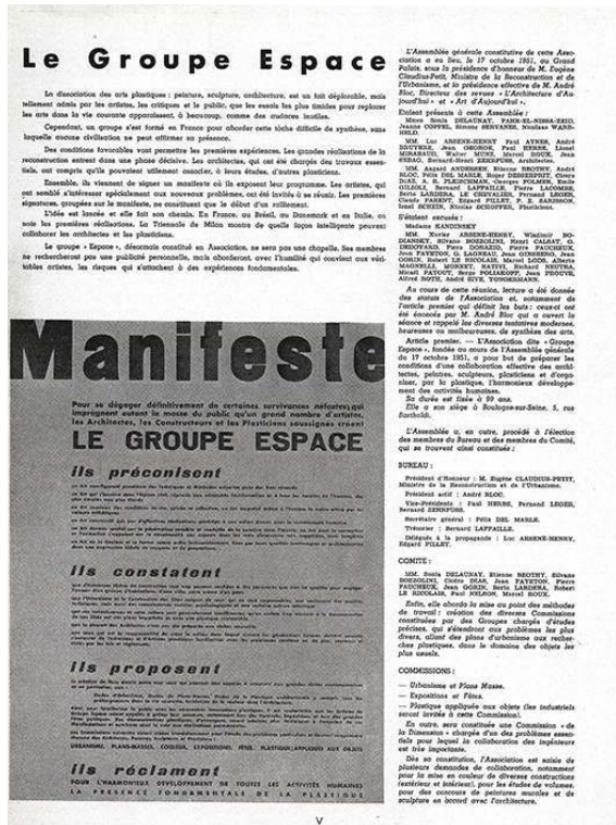
Manifeste du Groupe Espace, publié dans L'Architecture d'aujourd'hui, n° 37, 1951, p. V.