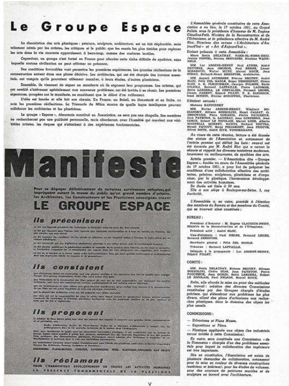
Manifeste du Groupe Espace, publié dans L'Architecture d'aujourd'hui, n° 37, 1951, p. V.